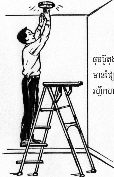
ចុះប៊ូតុងឧបករណ៍រោទិ៍ពេល មានផ្សែងដើម្បីចាប់ផ្តើមការ ហ្វឹកហាត់អំពីភ្លើងឆេះ ។