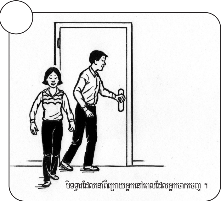
បិទទ្វារដែលនៅក្រោយអ្នកនៅពេលដែលអ្នកចាកចេញ ។