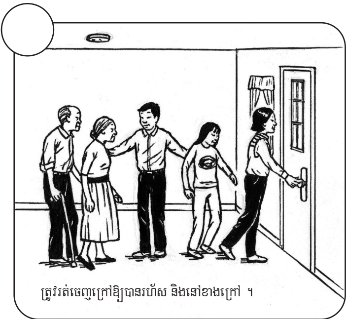
ត្រូវរត់ចេញក្រៅឱ្យបានរហ័ស និងនៅខាងក្រៅ ។