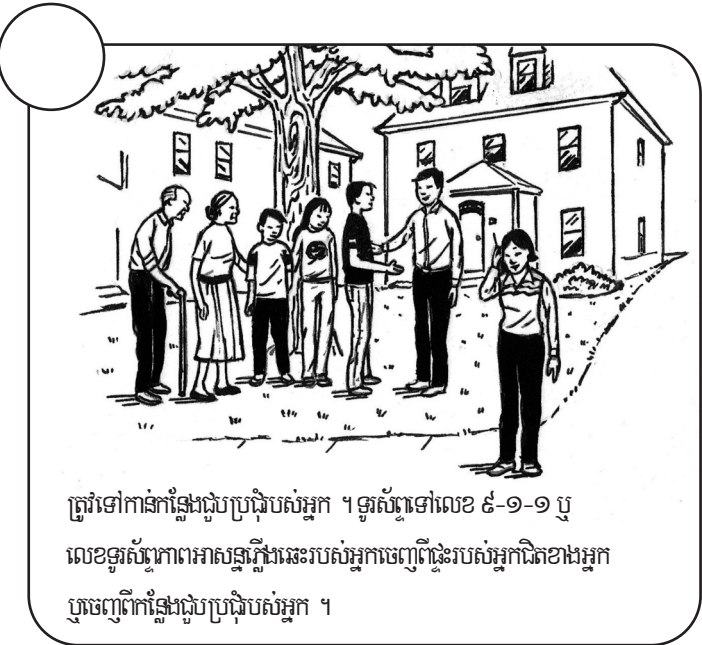
ត្រូវទៅកាន់កន្លែងជួបប្រជុំរបស់អ្នក ។ ទូរស័ព្ទទៅលេខ ៩-១-១ ឬ លេខទូរស័ព្ទអាសន្នភ្លើងនេះរបស់អ្នកចេញផ្ទះរបស់អ្នកជិតខាងអ្នក ឬចេញពីកន្លែងជួបប្រជុំរបស់អ្នក ។