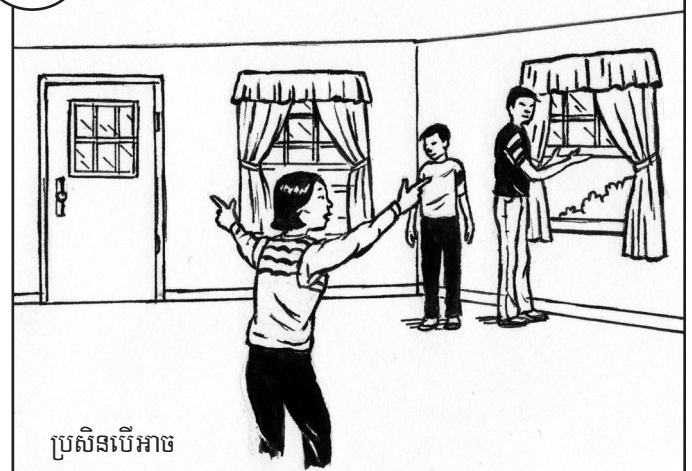
ប្រសិនបើអាច ត្រូវរៀបផែនការឱ្យមានច្រកពីរសម្រាប់ចេញពីបន្ទប់នីមួយៗ ។