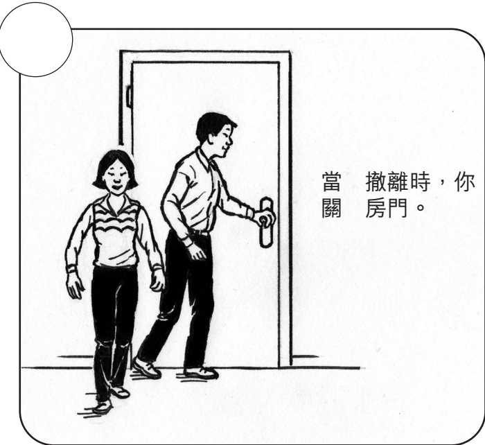
當 撤離時，你 關 房門。