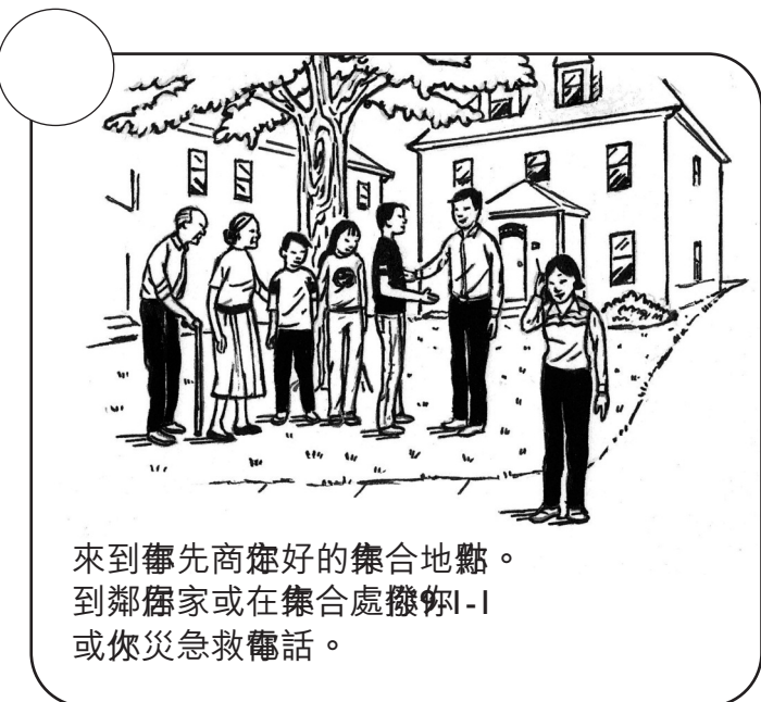
來到事先商議好的集合地點。 到鄰居家或在集合處撥打1-1 或你災急救電話。