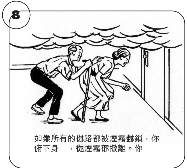
如樂所有的出路都被煙霧封鎖，你 俯下身，從煙霧你撤離。你