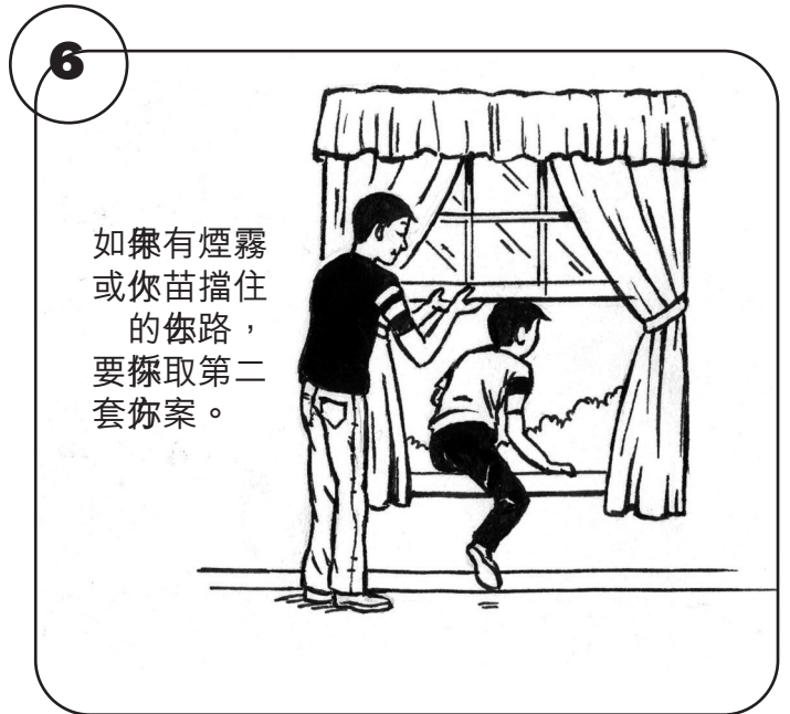
如樂有煙霧 或你擋住的 出路， 要採取第二 套方案。