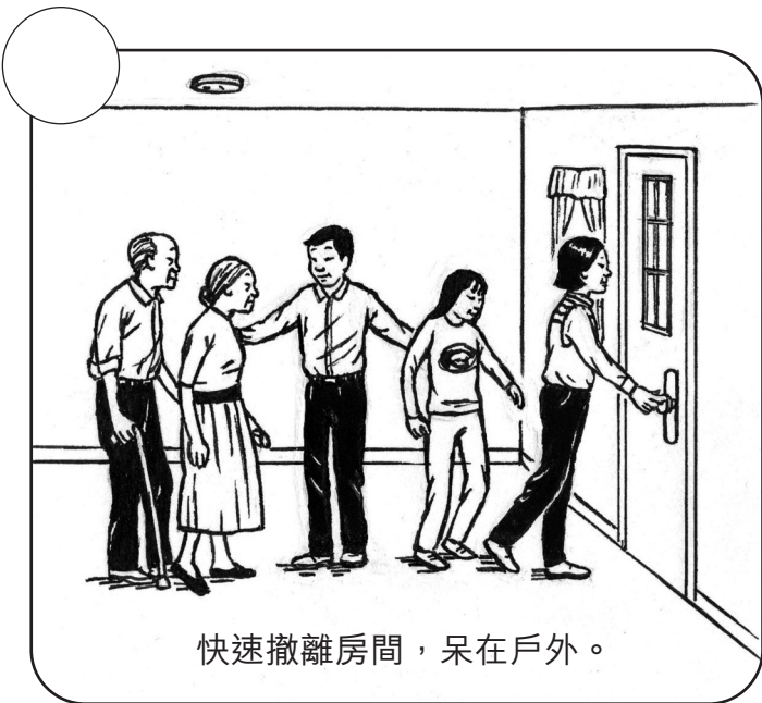
快速撤離房間，呆在戶外。